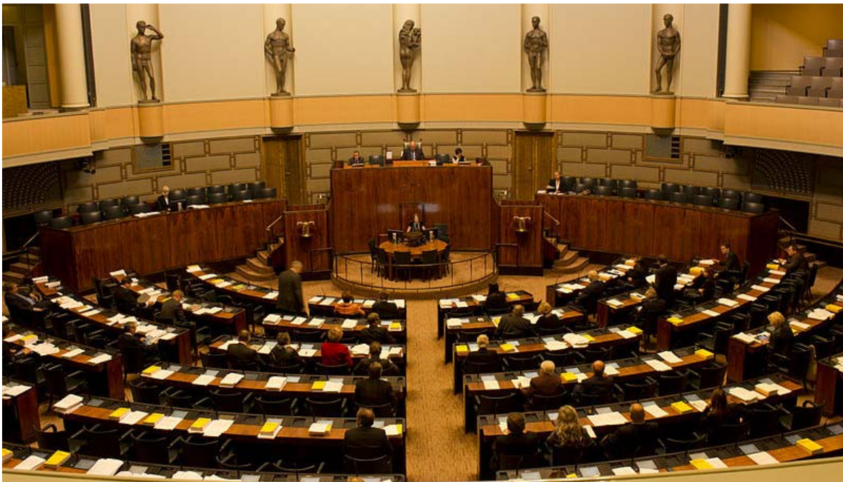
salle de reunion du Parlement finlandais