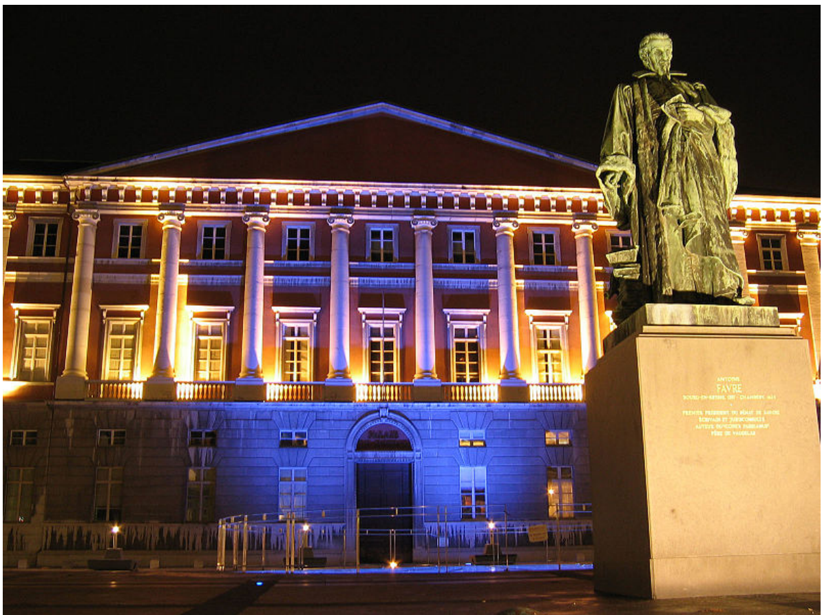
© Guillaume Bulet, Palais de Justice de Chambéry, France