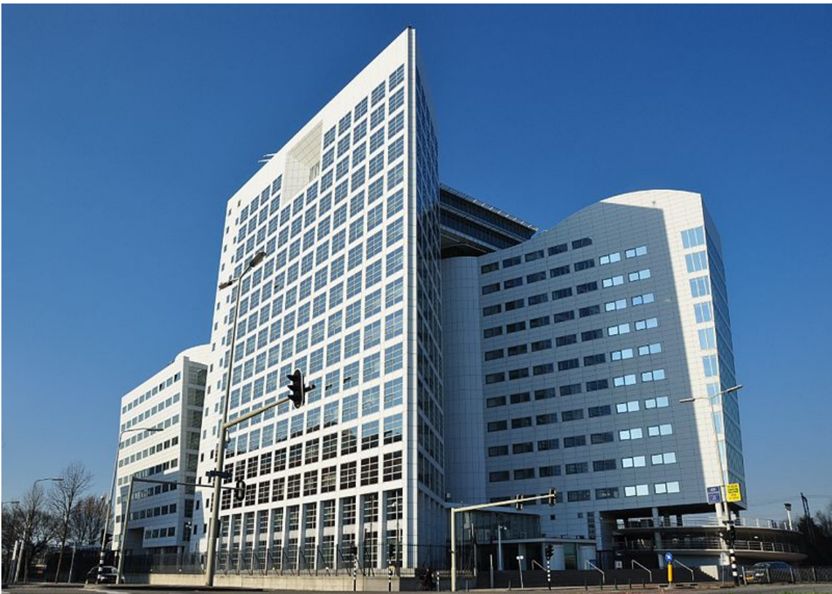
Cour Pénale Internationale, La Hague, Pays Bas